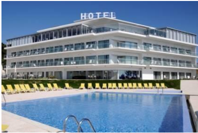
Hotelli Miramar Sul